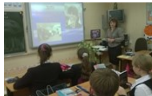
средняя школа №5

Лицензия РТ №001633 от 23.12.2011г. (бессрочная)